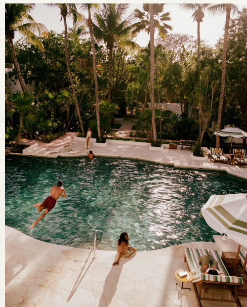
MAROMA Riviera Maya