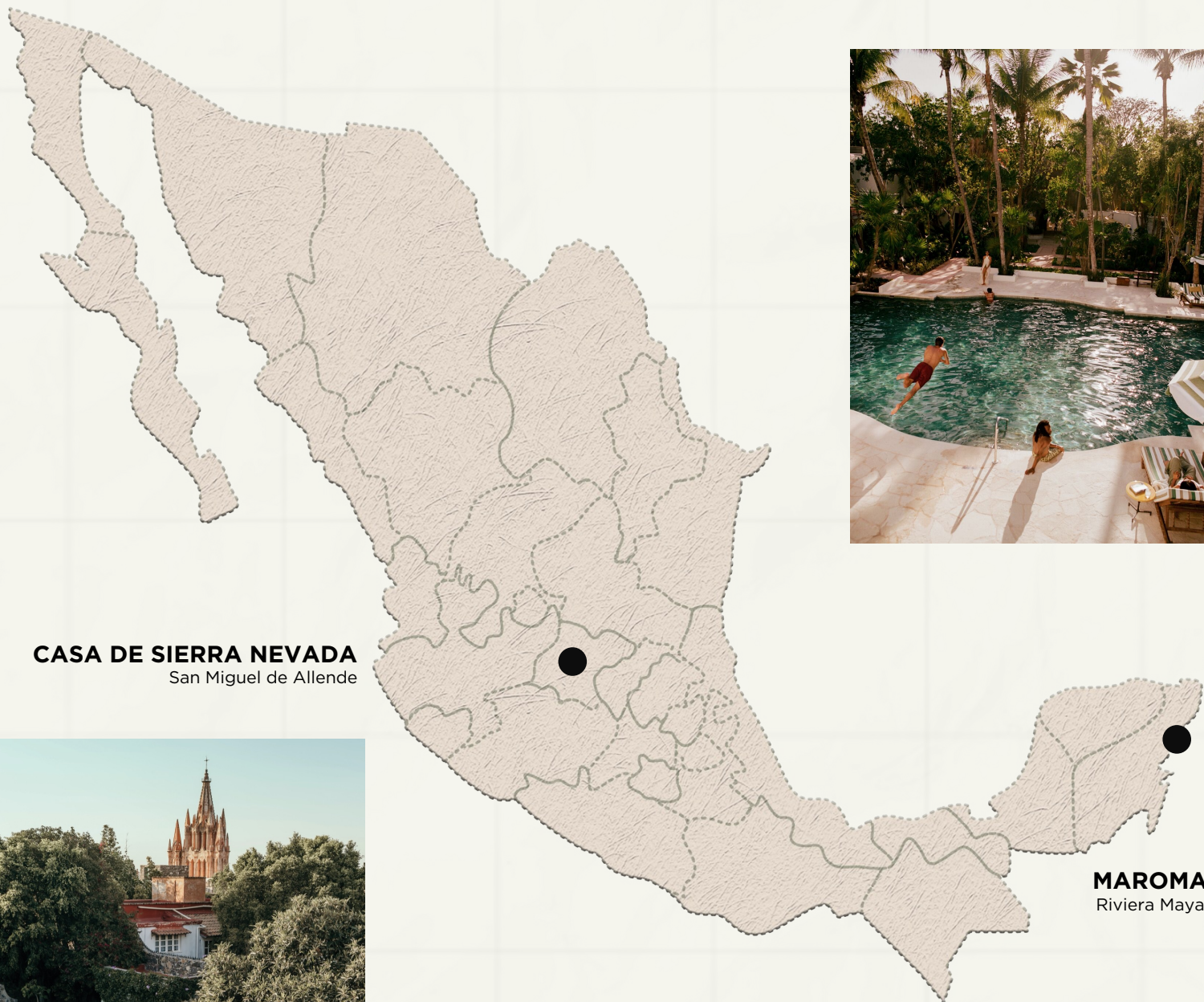
CASA DE SIERRA NEVADA San Miguel de Allende

DE LA COSTA CARIBE A LAS TIERRAS ALTAS DE SAN MIGUEL DE ALLENDE, ESTE RECORRIDO AVANZA A SU PROPIO RITMO. EN MAROMA, LA RIVIERA MAYA SE DESCUBRE ENTRE SELVA, MAR Y UNA MANERA DE HABITAR EL DESTINO MARCADA POR LA CALMA Y EL RITUAL. LA SIGUIENTE PARADA ES SAN MIGUEL DE ALLENDE, DONDE CASA DE SIERRA NEVADA ABRE LA PUERTA A PATIOS FLORIDOS, TALLERES DE ARTESANOS, TERRAZAS CON VISTA A LA PARROQUIA Y NOCHES QUE SE ALARGAN ENTRE COCINA, CONVERSACIÓN Y CIUDAD. DOS ESCENARIOS DISTINTOS, CADA UNO CON CARÁCTER PROPIO, UNIDOS POR UNA MISMA SENSIBILIDAD HACIA EL LUGAR, EL SABOR Y EL TIEMPO BIEN VIVIDO.